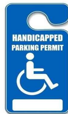
[imagen:] TARJETA DE ESTACIONAMIENTO POR DISCAPACIDAD

Algunos pacientes con AIJ califican para recibir tarjetas de estacionamiento por discapacidad según el Departamento de Vehículos Motorizados en la mayoría de los estados. Además, algunas universidades, escuelas y lugares de trabajo pueden ofrecer “Estacionamiento por dificultades” a pacientes que padecen AIJ y que no califican para recibir una tarjeta de discapacidad.